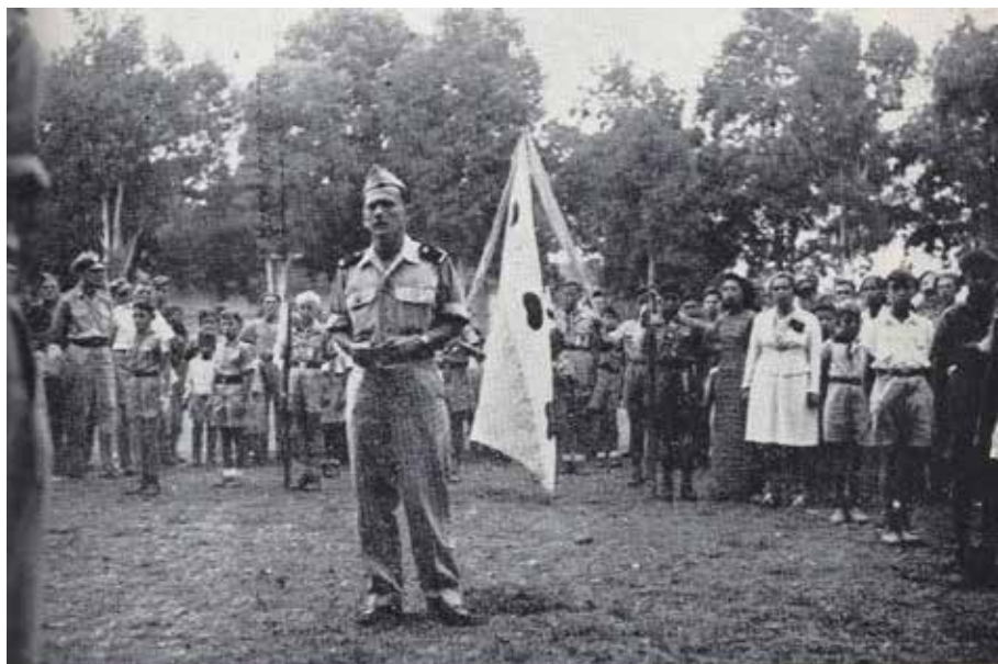
Frieslanddag in Tjimahi: Padvinders bieden een Friese vlag aan

‘The men could bask in the golden glow of Allied victory while enjoying ‘a magnificent time of feasting’ on seemingly unlimited supplies of cigarettes and alcohol, the unofficial currencies of the day’.