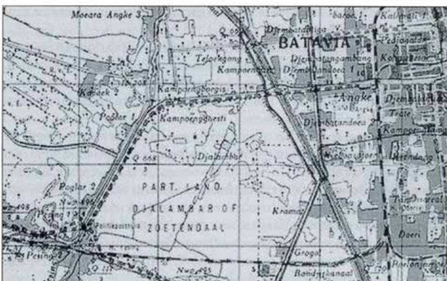
Situatieschets Grogol - Pesing.

Vrij snel na de actie ontstond er ophef. Het PvdA-Kamerlid Nico Palar, die de republikeinse zaak was toegedaan, beweerde op 6 mei dat zeventig Indonesische gevangenen op last van de MP op beestachtige wijze waren vermoord, de lijken in de rivier gegooid. Drie man werden later zwaargewond aangetroffen. In de desa waren vele woningen verbrand. In de Baanbreker had de schrijfster Beb Vuyk kort daarvoor een emotioneel, zo niet hysterisch, artikel over de 'moorden van Pesing' geschreven: 'De