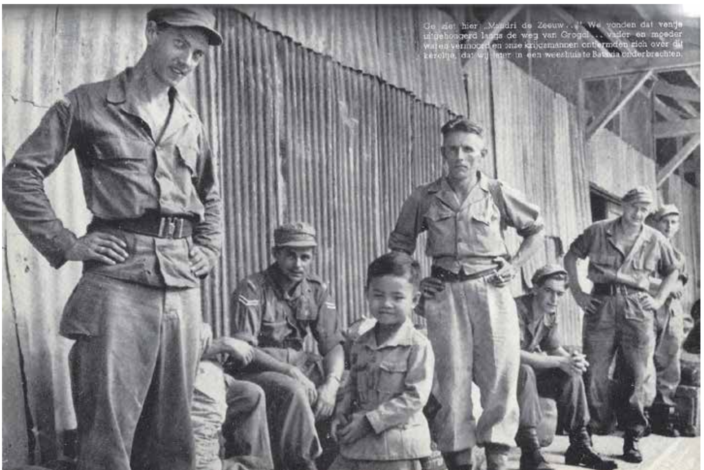
Op dit hier „Mandri de Zesuw...“ We vonden dat vende is gehongerd langs de weg van Grogol... vader en moeder waren vermoord en onze krijgslieden ontfermden zich over dit beroljke, dat wij later in een weeshuis te Batavia onderbrachten.